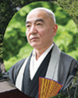
芥川賞作家・福聚寺住職 玄侑宗久師